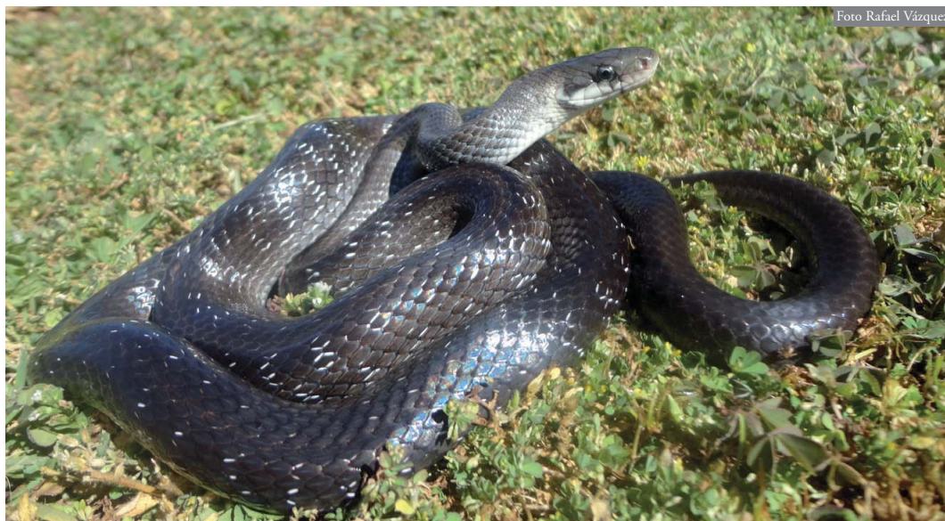
Figura 2: Ejemplar adulto de Z. longissimus observado en el núcleo urbano de Llamas de Cabrera (localidad 6).

estar en el propio pueblo, el lugar no es frecuentado por sus habitantes debido al mal estado de las casas y a la inexistencia de huertas u otras zonas de tránsito. Presenta una vegetación compuesta por árboles de fruto como nogales ( Juglans regia ), castaños ( Castanea sativa ), higueras ( Ficus carica ) y manzanos ( Malus domestica ). A menos de 100 m se localiza un arroyo que, junto con la vegetación arbórea existente, imprimen un elevado carácter húmedo a la zona.