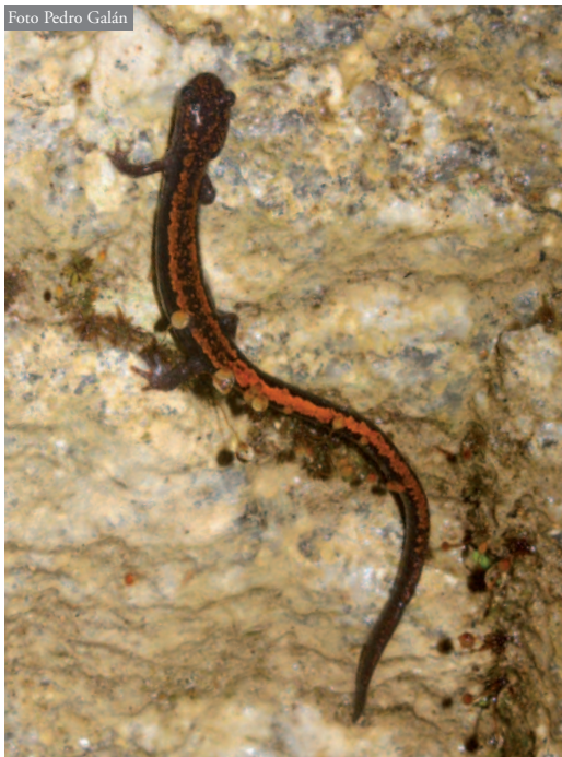
Figura 2. C. lusitanica desplazándose por un talud vertical (90° de inclinación) de roca granítica. Serra de Montemaioir, Cerceda, A Coruña.

En los muestreos, al observar a individuos activos de cada una de las dos especies, se anotó, en el punto de la observación, si estaban en suelo llano o en un talud y, en el segundo caso, la altura vertical sobre el nivel del suelo (con una cinta métrica) y el ángulo de pendiente en ese punto (con un medidor de ángulos). No se tuvo en cuenta, en este caso, el sexo o la edad de los individuos observados.