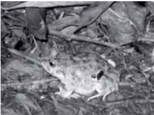
Figure 1. Adult male P. cinereum collected near the city of Cochabamba.

The distribution of Pleurodema cinereum (Figure 1) in Bolivia includes the departments of Cochabamba, Chuquisaca, La Paz, Oruro and Potosí (de la Riva et al. , 2000; Aguayo et al. , 2007), whereby it is found in ephemeral ponds during the humid season, changing to a fossorial life in the dry season (Cei, 1980; Köhler, 2000; Aguayo et al. , 2007).