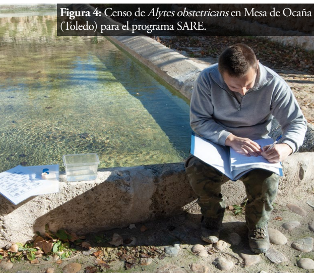
Figura 4: Censo de Alytes obstetricans en Mesa de Ocaña (Toledo) para el programa SARE.

Finalmente, presentamos el proyecto SOS Anfibios ( https://sosanfibios.org ; Figura 5) coordinado por Jaime Bosch, que se inició en 2020 y cuyo objetivo es doble. Por un lado, estudiar en profundidad la distribución y la incidencia en España de los tres principales patógenos emergentes de anfibios: Batrachochytrium dendrobatidis (Bd), B. salamandrivorans (Bsal) y Ranavirus . Por otro, ayudar en el control de estos agentes infecciosos mediante diagnóstico y asesoramiento gratuito para la remediación a administraciones, asociaciones conservacionistas, empresas e, incluso, particulares. Hasta el momento de presentar la candidatura, el programa había recibido más de 8000 muestras, había registrado 14 eventos de mortalidad masiva de anfibios, y había desarrollado distintas actuaciones para controlar la entrada y dispersión de patógenos a través del comercio de mascotas. Por desgracia, los análisis de laboratorio ponen de manifiesto lo preocupante de la situación: más del 25% de los ejemplares analizados están infectados con, al menos, uno de los patógenos estudiados. Pero a la vez, y de forma esperanzadora, el proyecto ha pue-