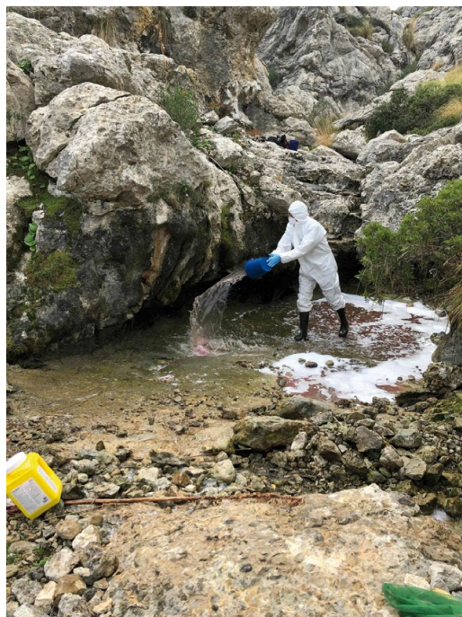
Figura 5: Desinfección de zonas de ferreret ( Alytes mu- letensis ) en Mallorca.

Concurrimos a estos premios avalados por la Sociedad Española de Ornitología (SEO), la Fundación Biodiversidad, the Societas Europaea Herpetologica (SEH), la Universidad Complutense de Madrid, el Comité Español de UICN (CeUICN) y el Ministerio para la Transición Ecológica y el Reto Demográfico (MITECO). El jurado destacó en su acta que