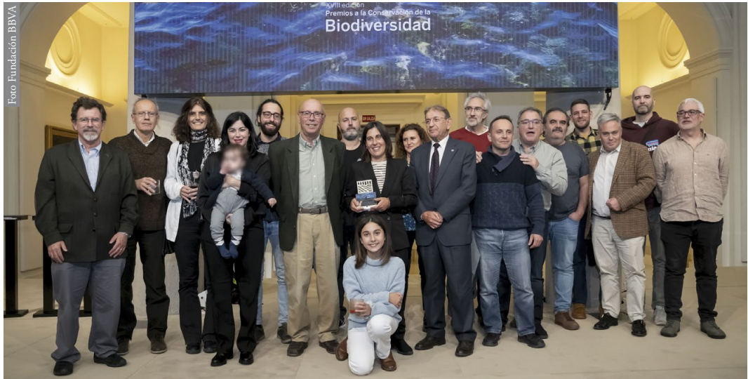
Figura 2: Fotografía a socios y socias, trabajadores y familiares de la AHE tomada tras la ceremonia de entrega del premio.

En segundo lugar, presentamos el programa de Seguimiento de Anfibios y Reptiles de España (SARE), que se inició en 2008 con el apoyo del Ministerio de Agricultura, Alimentación y Medio Ambiente. A través de este programa, cualquier herpetólogo/a puede aportar datos de presencia y abundancia de especies de anfibios y reptiles, mediante el seguimiento de cuadrículas UTM de 10 x 10 km a lo largo del tiempo, y sin