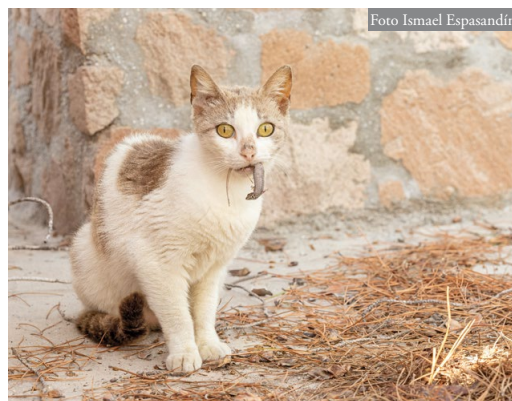
Figura 2: Ejemplar de gato asilvestrado ( Felis silvestris catus ) con un individuo de Podarcis milensis antes de ser devorado.