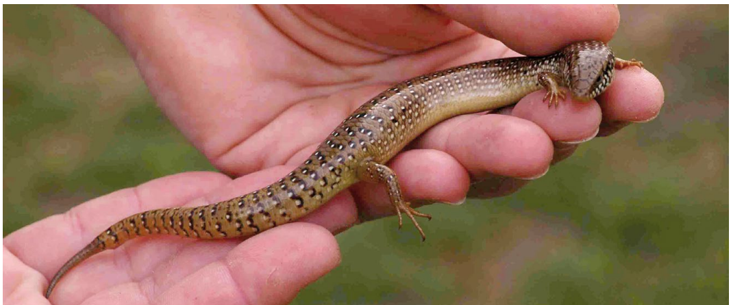
Figura 1: Chalcides ocellatus ingresado en el Centro de Recuperación de Fauna de “La Granja” (El Saler, Valencia) en 2006.

palmeras de Egipto”. Tiempo después, en abril de 2017 se detectó la presencia de una población reproductora de esta especie exótica en la Sierra del Molar (Elche, Alicante; Bisbal-Chinesta et al. , 2020). Para determinar su origen estos autores realizaron análisis genéticos, concluyendo que los ejemplares ilicitanos eran muy similares a los del Delta del Nilo (Egipto). Se propusieron tres posibles vías de introducción: fueron traídos por los fenicios algunos siglos antes de nuestra era, opción apoyada por los abundantes yacimientos de esa cultura en el entorno de la localidad donde se hallaron los eslizones; llegaron en la Edad Media con el tráfico de bienes y tropas entre Egipto y Al-Andalus, o lo hicieron recientemente con el tráfico de palmeras. Finalmente, Pérez-García et al. (2022) realizaron encuestas a propietarios de casas de campo y de viveros de plantas en la comarca de Elche, obtenien-