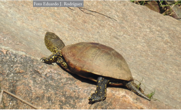
Figura 2: Emys orbicularis observado el 22 de febrero de 2020 en la Rivera de Cala. Cuadrícula QB 58. Término municipal de El Ronquillo.

dian­te transectos para observación y fotografía de ejemplares desde las orillas, lo que no permitió estimar densidades poblacionales, sino sólo presencia (Figura 2). No se repitieron transectos en las zonas donde la especie había sido ya detectada en el periodo 2018-2020. El número de personas participantes estuvo siempre comprendido entre dos y tres.