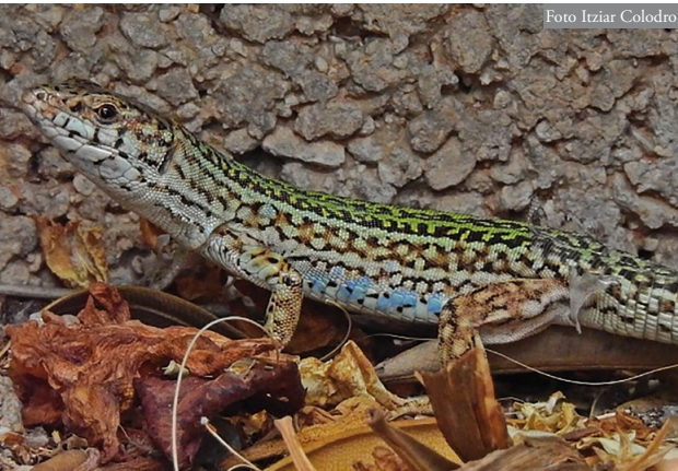
Figura 3: Macho adulto de Podarcis pityusensis presente en el puerto de Dénia.

(Figura 1), aunque es previsible que se extienda a otras zonas ajardinadas, descampados y muros del puerto, en especial las más próximas a los muelles de embarque de los ferris. Se desconoce desde cuándo están presentes en esta área, pero se han observado ejemplares de todas las clases de edad, así como interacciones reproductoras entre adultos (ver información complementaria: http://www.herpetologica.org/BAHE/videos/ms1011_podarcis_denia.mp4 ), por lo que parece que se ha establecido una población viable (Figuras 3 y 4). A diferencia de las otras poblaciones peninsulares de esta especie, que fueron introducidas por el ser humano de manera activa, todo indica que la población de Dénia se ha establecido a partir de transporte pasivo de ejemplares polizones en los ferris de la línea Dénia-Formentera.