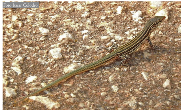
Figura 4: Juvenil de Podarcis pityusensis en el área de estudio.

varios ejemplares atropellados y se observó un cernícalo vulgar ( Falco tinnunculus ) cazando con éxito una lagartija (I. Colodro, observación personal). Aunque las observaciones realizadas sugieren que esta población no se extiende fuera del área urbana de Dénia, sería al menos recomendable realizar un seguimiento periódico como medida de precaución. Si las lagartijas estuvieran ya ocupando zonas no urbanas de la periferia, se podrían añadir a la lista de depredadores potenciales algunos ofidios ibéricos como Hemorrhhois hippocrepis y Zamenis scalaris , que actualmente están produciendo un impacto considerable sobre las poblaciones nativas de lagartija tras su introducción en Ibiza y Formentera (Torres-Oriols, 2013; Hinkley et al. , 2016).