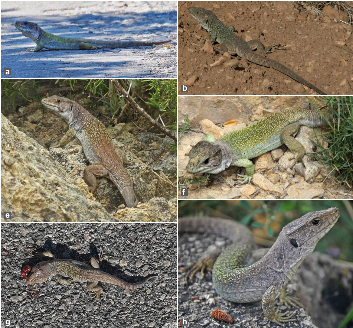
Figura 2: Ejemplares referidos en la presente nota. a) Torreblanca; b) Atzeneta del Maestrat; c) Culla; d) Benicarló; e) Rossell; f) Mas de Barberans; g) Tortosa; h) Roquetes; i) La Sènia; j) Beceite.

Buchholz (1963) describió originalmente el holotipo de T. lepidus nevadensis como un lagarto con diseño simple, sin colores brillantes ni escamas negras, 76-90 escamas de la fila transversal dorsal y mayor tamaño que la subespecie nominal. Por su parte, Mateo (1988) detalla mucho más las diferencias y añade un cráneo más alargado y mayor número