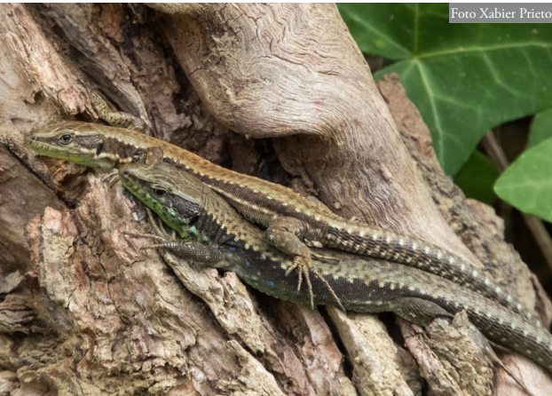
Figura 1: Dos de los ejemplares observados en la ciudad de Ferrol en febrero de 2020.

papel de su importante industria naval, siendo uno de los puntos con mayor capacidad industrial de toda Galicia. En los últimos años, la construcción de polígonos industriales civiles y de grandes infraestructuras viarias han eliminado amplias zonas de huerta y cultivos colindantes a la ciudad. Sin embargo, quedan pequeños retazos del bosque caducifolio original en diferentes puntos próximos a la ciudad, compuestos principalmente por Quercus robur o saucedas de Salix atrocinerea en sus zonas más húmedas.