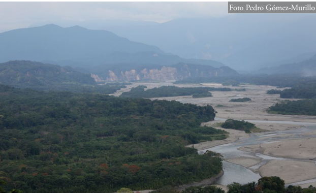
Figura 2: Hábitat de B. sanctaerucis en los alrededores de Villa Tunari, Cochabamba, Bolivia.

muestreos enfocados a la búsqueda de B. sanctaerucis en diversas zonas del bosque Amazónico pre-Andino del municipio de Villa Tunari y sus alrededores (Provincia Chapare, Departamento de Cochabamba, Bolivia).