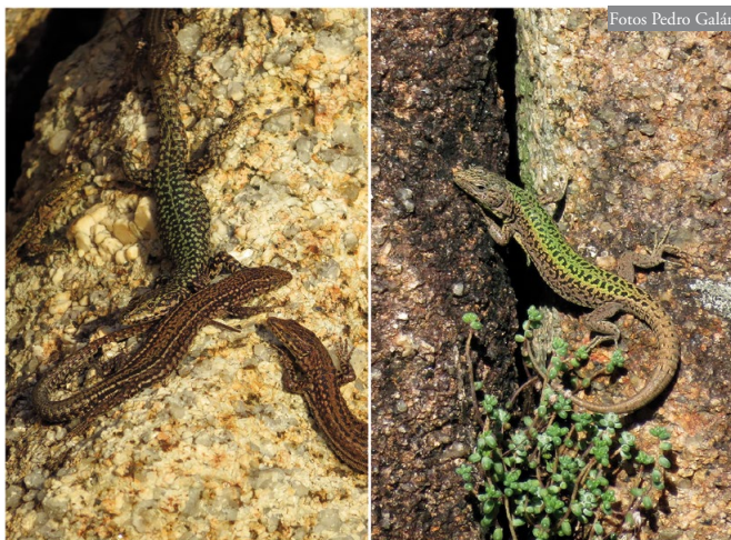
Figura 3: Izquierda, Podarcis guadarramae , un macho adulto rodeado de varias hembras (O Pedrullo, Pindo). Derecha, Podarcis bocagei , macho adulto (Alto das Cortes, Pindo). Ambas especies ocupan los medios rocosos de este monte, incluso P. bocagei , en principio no saxícola y mucho menos trepadora que P. guadarramae ; sin embargo, se observaron diferencias en el uso de los microhábitats (ver texto).

gei , sin embargo, utilizó estos dos sustratos de vegetación y tierra con cierta frecuencia (Tabla 2). Estas diferencias en el tipo de sustrato seleccionado resultaron altamente significativas entre ambas especies ( \chi^2 = 33,36 ; gdl = 4; P < 0,0001 ). En cuanto al tipo de refugio buscado cuando se sienten amenazadas, también se observaron marcadas diferencias entre las dos especies. Podarcis guadarramae seleccionó principalmente las grietas en las rocas, mientras que P. bocagei lo hizo entre la vegetación y en pocas ocasiones trepó a alturas elevadas en los roquedos, como con frecuencia hace P. guadarramae (Tabla 2). Estas diferencias en las zonas de refugio también resultaron altamente significativas ( \chi^2 = 33,01 ; gdl = 3; P < 0,0001 ).