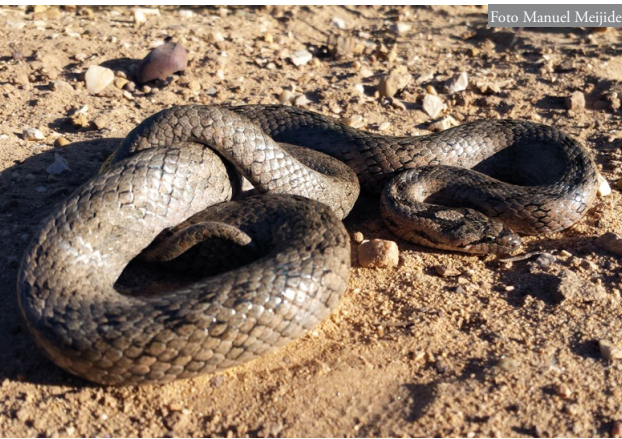
Figura 2: Detalle de Coronella girondica en el que se observa el grosor del cuerpo, debido al proceso de vitelogénesis.

Previamente se habían observado varios cadáveres de C. girondica depredados por Buteo buteo en el mismo camino, por lo que se retiró al animal del mismo, no solo para evitar su posible depredación sino porque la vía se encuentra muy transitada por bicicletas todo terreno. Tras recoger al animal (muy dócil), se procedió a su medición y