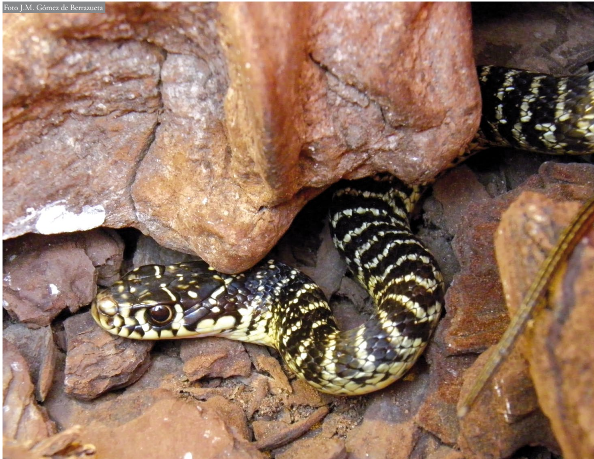
Figura 1: Hierophis viridiflavus entregado en las instalaciones del Zoo de Santillana.

cias. Especies provistas de una mayor capacidad de movimientos pueden ser propensas a aparecer en las translocaciones. Este sería el caso de ciertos lagartos de pequeño tamaño, como las salamanquesas (Galán Regalado, 1999; Gómez de Berrazueta, 2006), o de los ofidios, siendo entre éstos uno de los casos más conocidos, y más graves, el de la introducción de la serpiente arbórea marrón ( Boiga irregularis ) en la isla de Guam tras la Segunda Guerra Mundial (Rodda et al. , 1992). Un caso anecdótico, pero al menos llamativo, fue la llegada al puerto de Santander de una cobra de bosque ( Naja melanoleuca ) en un carga-