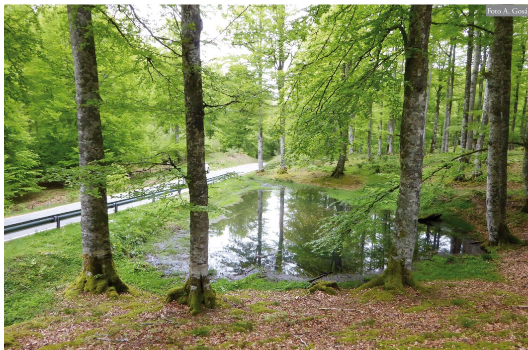
Figura 1: Charca de Zubarieta el 16 de mayo de 2018, donde se encontró la larva albina.

En un censo de anfibios especialmente enfocado al tritón alpino, realizado en la Zona Especial de Conservación de la sierra de Aralar (Navarra; Gosá et al. , 2019), el día 2 de julio de 2018 se capturó una larva albina de R. temporaria en la charca de Zubarieta (30T WN583281 / 4757413; 980 msnm; Figura 1), con un diámetro mayor de unos 25 m y profundidad máxima de 70 cm, localizada en hayedo ( Fagus sylvatica ). La larva, con una longitud total de 40,38 mm, se encontraba en el estadio de desarrollo 37 de Gosner, con