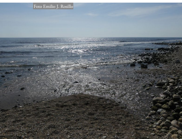
Figura 1: Desembocadura del río Seco, playa Punta del Riu, El Campello. Alicante.