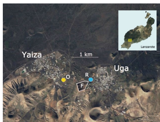
Figura 1: Fotografía aérea de Yaiza, Uga y alrededores, en la que se indica el punto en el que se detectó el ejemplar de R. scalaris (R), la zona donde se depositan los olivos antes de ser replantados (O) y los terrenos donde se están realizando repoblaciones con olivos y otros árboles ornamentales (F).

El día 2 de julio de 2017 a las 13 horas, el tercer autor detectó un ofidio de mediano tamaño cerca de la pedanía de Uga (28°57'01"N /