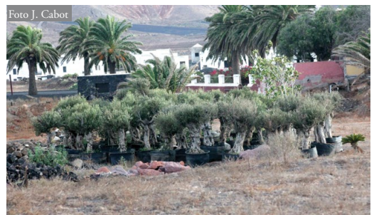
Figura 3: Núcleo restante de olivos de origen ibérico agrupados cerca de Yaiza (Lanzarote), que habían sido importados en 2016 con vistas a ser replantados con fines ornamentales en fincas cercanas con viñedos (véase también mapa de la Figura 1).

Es posible que el ejemplar de R. scalaris visto en los alrededores de Uga sólo sea un individuo aislado y que no exista un peligro inmediato de plaga, pero la proximidad de una concentración de olivos ibéricos destinados a la jardinería debería ser considerada como un indicio más que apunta a que la importación descontrolada y general de árboles ornamentales, y de olivos de forma particular, tiene consecuencias indeseadas, especialmente cuando ocurre en islas. Las administraciones competentes no deberían tardar, por eso, en establecer protocolos eficaces para evitar la entrada de ofidios y de otras especies relacionadas con el movimiento de plantas ornamentales.