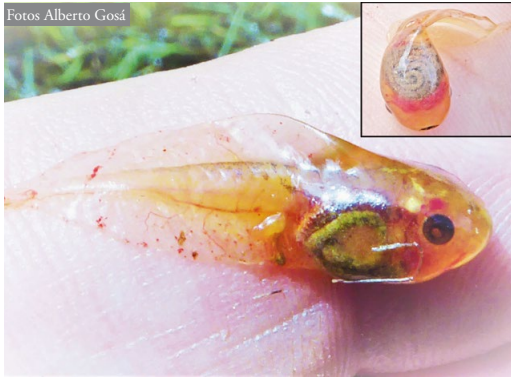
Figura 1: Vistas lateral y ventral de la larva albina de H. molleri encontrada en el Parque Natural de Izki (Álava).