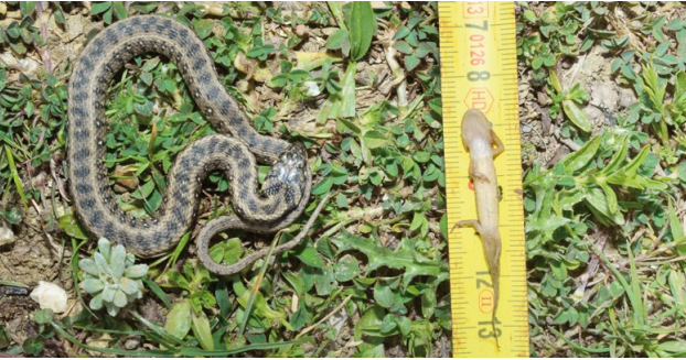
Figure 2: Natrrix maura specimen along with a regurgitated larva of Pleurodeles poireti .

Figura 2: Especímen de Natrrix maura junto con una larva recién regurgitada de Pleurodeles poireti .