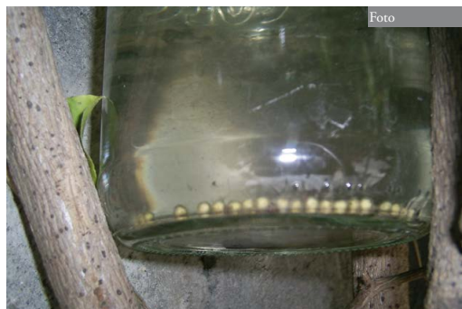
Figura 2: Puesta infértil de huevos de G. riobambae (26/06/2007).

Los individuos fueron observados mayormente en enredaderas como P. coccineus , B. glabra y P. mixta . No siempre permanecían en sitios específicos, pues se registró a tres ejemplares que se habían desplazado al menos unos 15 m.