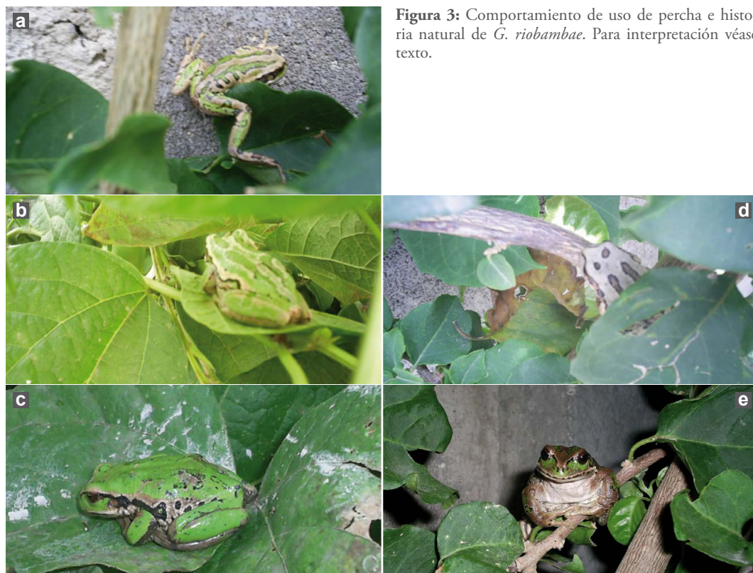
Figura 3: Comportamiento de uso de percha e historia natural de G. riobambae . Para interpretación véase texto.

Se observaron cuatro individuos en reposo adheridos a una pared de bloques, por la cual también se desplazaban (Figura 3a), aprovechando la sombra y el escondite que les proporcionaban hojas y ramas hasta una altura de 3 m. Cinco individuos fueron vistos dentro de los bloques de construcción y tres semienterrados (dos individuos bajo la tierra, aproximadamente a 10 cm de profundidad y un individuo