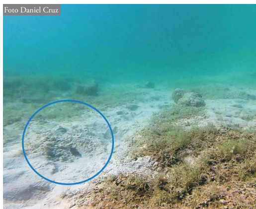
Figura 1: Vista del lugar y momento de la detección del animal. Obsérvese dentro del círculo al ejemplar camuflándose semienterrado en el sedimento.

La laguna se encontraba con la mezcla invernal de sus aguas y a 9 °C, temperatura algo superior a lo habitual en esta época del año. En superficie el día era soleado, habiendo amanecido con -4 °C y observándose 17 °C en superficie a la hora de la observación. Cabe destacar que durante los días anteriores la zona tuvo unas condiciones atmosféricas que permitieron temperaturas superiores a las normales para esa época del año.