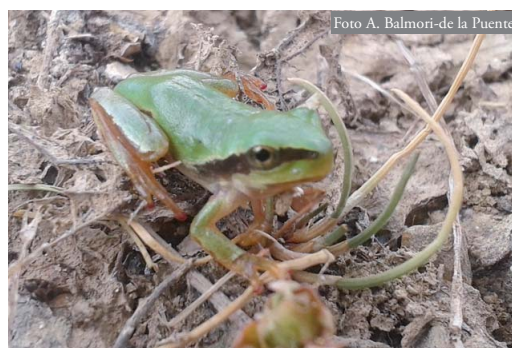
Figura 3: Posible híbrido ( Hyla arborea x H. meridionalis ).

El hallazgo descrito en esta nota podría indicar la continuación del avance de la especie hacia el norte, desde la Sierra de Bejar hasta la Sierra de Frades, en un lapso de algo más de 20 años, lo que supondría unos 30 km de nueva ocupación. Aunque menos probable, también cabe la posibilidad de que H. meri-