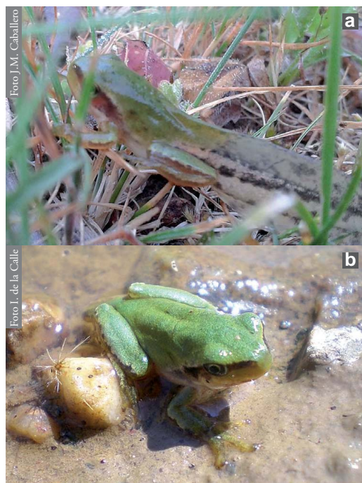
Figura 2: Detalle de un renacuajo (a) y de un individuo joven (b) de H. meridionalis localizados en la nueva cuadrícula.

Como resultado de nuevas prospecciones realizadas durante el 25 de mayo, el 12 de junio y el 22 de julio de 2014 en varias charcas ganaderas cercanas al área donde H. meridionalis está presente, se detectó a esta especie en una nueva cuadrícula (30TTL6305), en el término de Membribe de la Sierra (Coordenadas: 40.67096 N, 5.7942 W), en el entorno de la Sierra de Frades, al norte de las conocidas anteriormente (Figura 1). Los ejemplares encontrados eran numerosos, pero no se pudieron contabilizar con exactitud. Se trataba de larvas en las últimas fases de desarrollo y de jóvenes recién metamorfoseados (Figura 2), observaciones coincidentes con el patrón fenológico de desarrollo señalado para el área (García, 2007). En la misma charca estaba presente Hyla arborea y también posibles híbridos ( H. arborea x H. meridionalis ) (Figura 3), que presentaban caracteres intermedios entre ambas especies (Barbadillo & Lapeña, 2003).