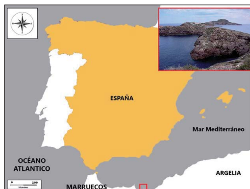
Figura 1: Situación geográfica e imagen de las Islas Chafarinas.

En el aspecto herpetofaunístico, la importancia de las Islas Chafarinas radica en la presencia de diversas especies de reptiles, algunas