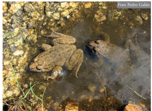
Figura 2. Adultos reproductores de D. galganoi en una charca de acantilado, donde se reproducen. Se puede observar el borde rocoso (granito) de la charca, así como el limo que en ocasiones se deposita en su fondo. Acantilados de la Torre de Hércules, A Coruña.

Las charcas son en general de tamaño reducido, muy someras y con vegetación, tanto acuática como terrestre sumergida, muy escasa (Tabla 1). En todos los casos, la cubeta de las charcas era de roca (granítica), pudiendo tener una pequeña capa de limo acumulada.