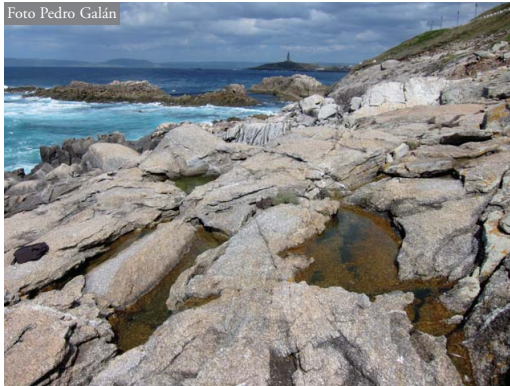
Figura 1. Charcas de lluvia en acantilados marinos utilizadas por D. galganoi para reproducirse. Acantilados del Monte de San Pedro, A Coruña. Al fondo se ve la península de la Torre de Hércules, donde existen otras charcas muy similares en las que también se reproduce este anfibio. Se puede apreciar la gran proximidad al mar de estas charcas.

de la isla de Sálvora, Aguiño (29T MH9901). En todas estas localidades, en cada charca en la roca donde se observó reproducción de D. galganoi se anotaron sus dimensiones (longitud x anchura, para calcular su superficie), profundidad máxima del agua y porcentaje de vegetación acuática y/o terrestre sumergida, en caso de haberlas. También se anotó el número de charcas utilizadas por la especie para la reproducción, el total de charcas con agua, así como si estas charcas contenían sólo agua de lluvia o recibían además agua de escorrentías procedentes de la parte superior del acantilado.