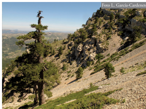
Figura 2. Hábitat de A. marchi en la vertiente umbría de La Sagra.

Aunque la distribución de A. marchi puede considerarse una de las mejor conocidas actualmente de la herpetofauna ibérica (Carretero et al. , 2010), ejemplos como el hallazgo de la especie en el Pico Lobos (Quirantes et al. , 2000), en Moratalla