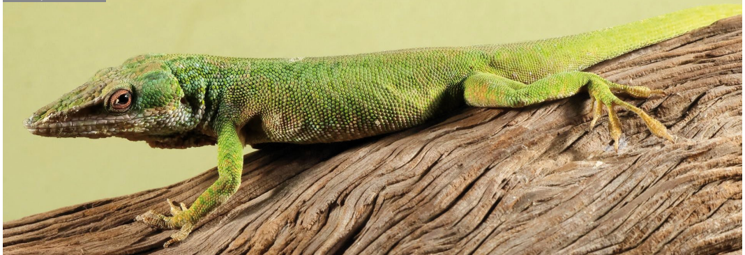
Figura 1: Macho de Anolis porcatius .