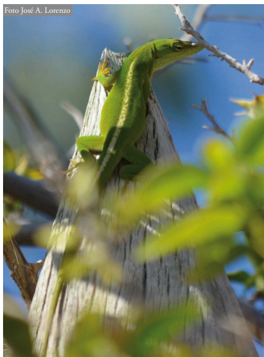
Figura 2: Hembra de Anolis porcatius .

cana, isla Saipán, Hawái o incluso en Florida (Powell et al. , 1990; Wiles & Guerrero, 1996; Suzuki-Ohno et al. , 2017; Goldberg & Kraus, 2018; Wegener et al. , 2019), se decidió incluir el género Anolis completo en el Real Decreto 216/2019, de 29 de marzo, por el que se aprueba la lista de especies exóticas invasoras preocupantes para la región ultraperiférica de las islas Canarias y por el que se regula el Catálogo español de especies exóticas invasoras.