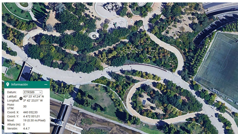
Figura 1: Ubicación de la población de Podarcis sicula y plantación de lavanda..

de la Guerra Civil española. Por último, la observación valenciana parece estar vinculada al tráfico marítimo, al encontrarse en la escollera del puerto de Valencia, aunque no puede considerarse una población, sino más bien un registro puntual.