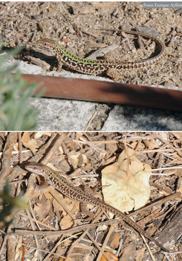
Figura 3: Dos ejemplares observados entre las lavandas en los muestreos realizados en 2018, con rasgos de P. s. campestris .

Pese a no estar incluida en el Catálogo Español de Especies Exóticas Invasoras (CEEI), en un minucioso trabajo publicado sobre una revisión de las especies exóticas en España Ayllón et al. (2015) proponen la inclusión de la lagartija italiana en el CEEI, basado en Carretero & Silva-Rocha (2015) y aduciendo el carácter dañino de estas introducciones para la biota nativa. El objetivo de esta nota es poner en conocimiento la existencia de dicha población, desconociéndose el vector de introducción, aunque suponiendo que la misma se debió a la entrada de la especie junto a planta de jardinería. La inexisten-