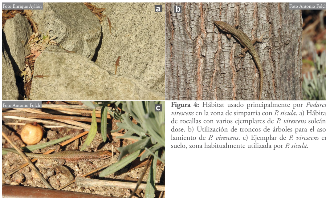
Figura 4: Hábitat usado principalmente por Podarcis virescens en la zona de simpatria con P. sicula . a) Hábitat de rocallas con varios ejemplares de P. virescens soleándose. b) Utilización de troncos de árboles para el asolamiento de P. virescens . c) Ejemplar de P. virescens en suelo, zona habitualmente utilizada por P. sicula .

búsqueda de posibles poblaciones en otras zonas de Madrid Río, la localización de viveros que hayan podido importar plantas de origen italiano y la revisión de dichos viveros para cerciorarse de la no existencia de nuevas poblaciones. En este sentido, una fotografía de un ejemplar juvenil de la especie tomada en 2011 en el Parque Warner, San Martín de la Vega, Madrid (coordenadas UTM: 449506 /