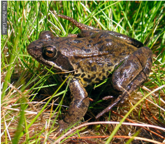
Figura 1. Macho adulto de Rana temporaria . Cabeza de Manzaneda, Pobra de Trives (Ourense). 1708 m de altitud. Los adultos de ambas poblaciones de montaña se caracterizan por su tamaño grande y su pigmentación generalmente oscura.

el límite de Ourense con León y Zamora (sierras de Trevinca-Eixe y Segundeira) (Bas, 1983; Balado et al. , 1995; Esteban & García-París, 2002). No existe más información sobre estas poblaciones que la estrictamente geográfica, que señala su presencia en cuadrículas UTM de 10x10 km y la indicación de que se encuentran relegadas a las zonas más elevadas de estas sierras (Balado et al. , 1995).