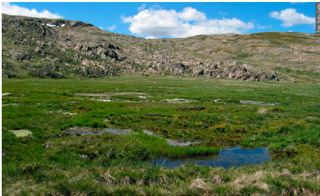
Figura 3. Turbera de Lagunas Herbosas, Sierra Segundera, Sanabria (Zamora). 1804 m de altitud. Hábitat de Rana temporaria en la zona.

(Esteban & García-París, 2002), se cita la presencia de Rana temporaria en cuatro cuadrículas UTM de 10x10 km nuevas (Figura 2), dos en el Macizo Central (PG38 y PG48) y otras dos en Trevinca-Segundeira (PG87 y PG88).